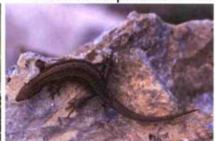
Lucertola vivipara NO