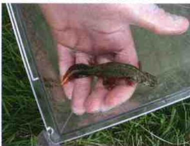
Tritone crestato NO