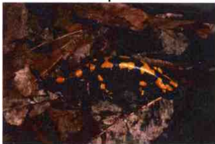
Salamandra pezzata NO